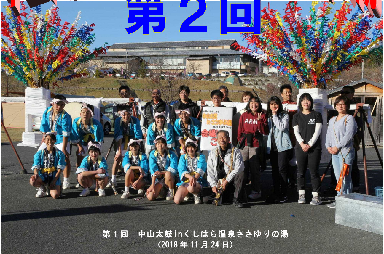
第1回 中山太鼓inくしはら温泉ささゆりの湯 (2018年11月24日)