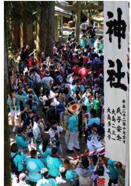
昨年の中山神社大祭の様子 (2018年10月21日)