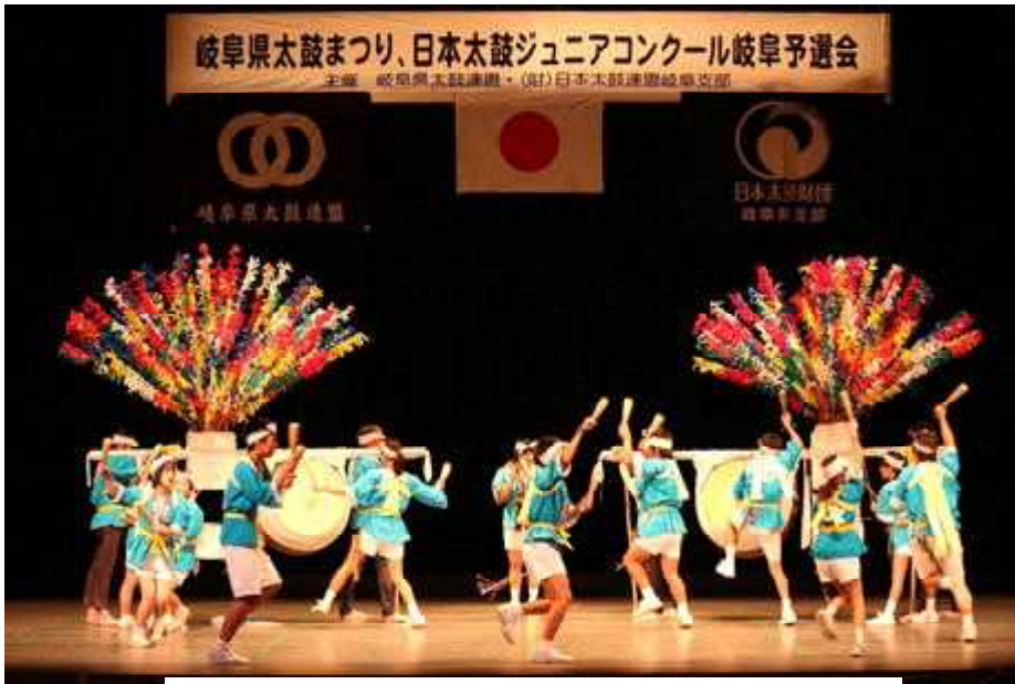
岐阜県太鼓まつりでの演奏 (2018年10月28日)

私たちが串原中学校では、全校生徒が地域の伝統文化を継承していくために、中山太鼓少年部に所属し、毎週金曜日の6時間目に太鼓練習をしています。その練習の成果を、運動会や地域の文化祭、岐阜県太鼓まつりなどで披露しています。